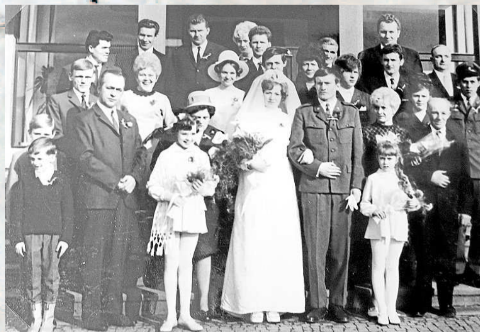
HORNICKÁ SVATBA z řad pracovníků Dolu Dukla v první polovině 70. let v Havířově.