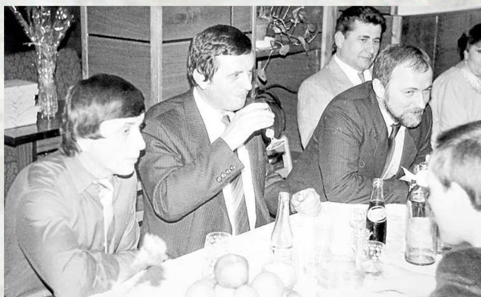
V REKREAČNÍM STŘEDISKU v Tyře se 4. dubna 1987 konala slavnostní porada spojená s oslavou Mezinárodního dne žen.