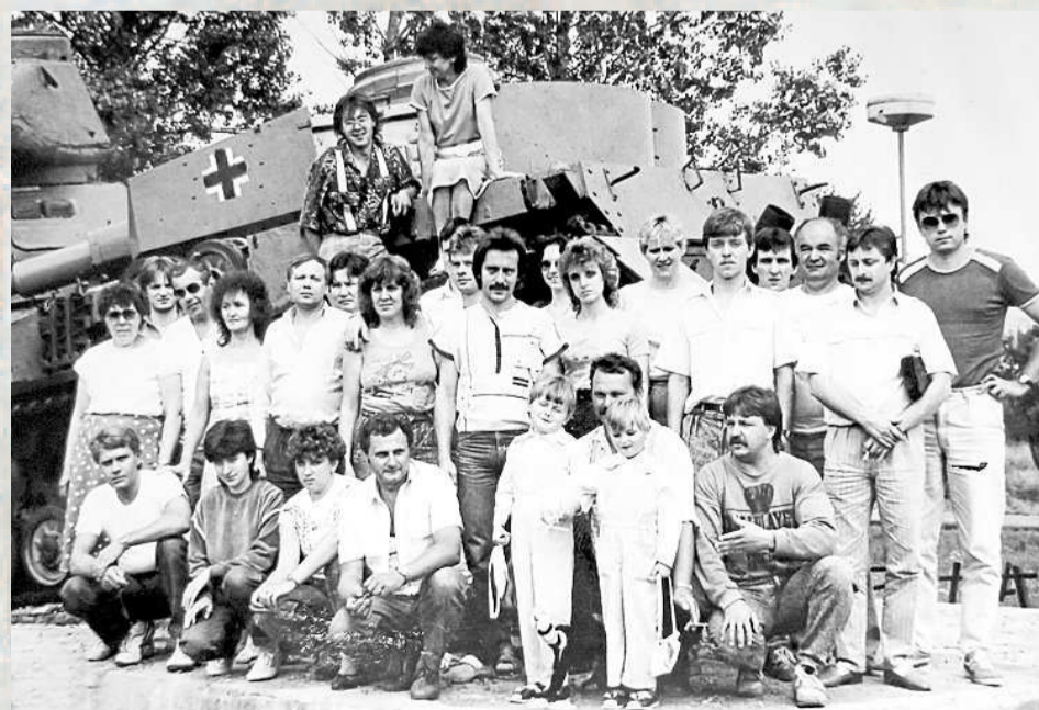
ZÁJEZD NA SLOVENSKO. Pracovníci Dolu Prezident Gottwald na výletě v místech Karpatsko-dukelské operace.

PŘÍŠTĚ, V PÁTEK 22. ÚNORA, ZAVÍTÁME DO KARVINÉ.