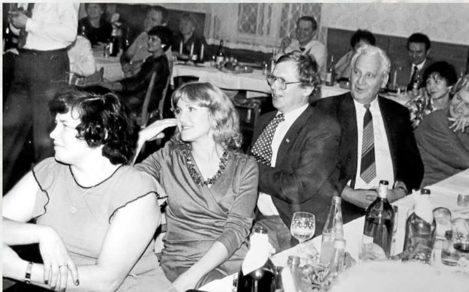
SLAVNOSTNÍ PORADA ČLENŮ BSP mechanických dílen v rybářské boudě v květnu roku 1984.