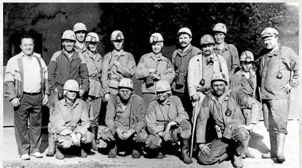
SPOLEČNÉ FOTO po vyfárání zástupců BSP Tesly Havířov a mechanických dílen v roce 1989.