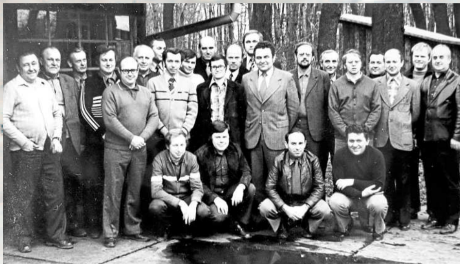
ARCHIVNÍ SNÍMEK Z ROKU 1968 zakládajících členů BSP mechanických dílen Dolu President Gottwald.