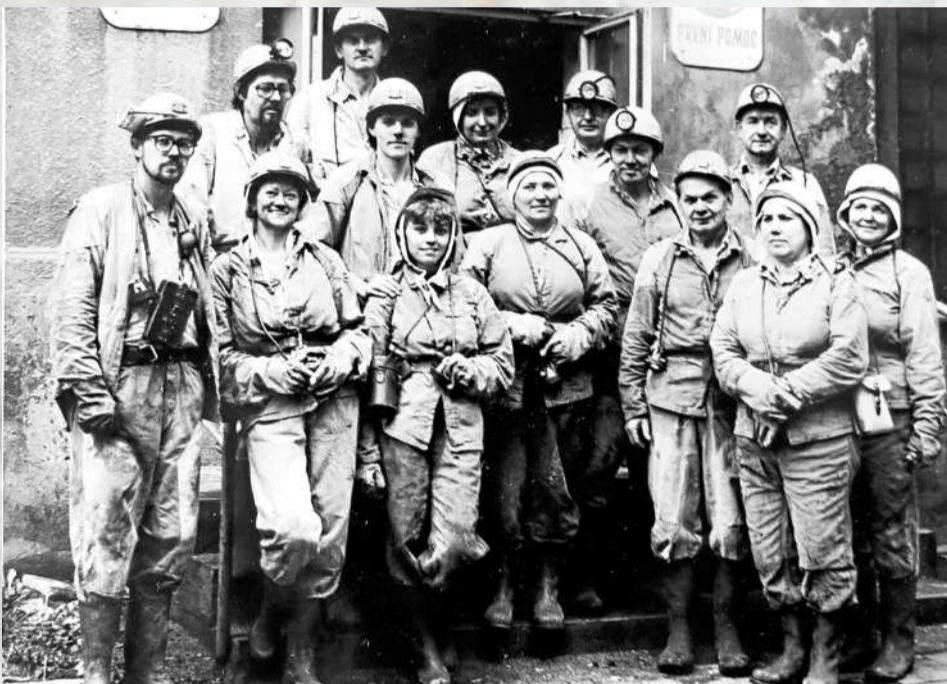
FÁRÁNÍ DELEGACE ZÁVODU 5 z Třineckých železáren v září 1982 v rámci výměny zkušeností mezi brigádami.