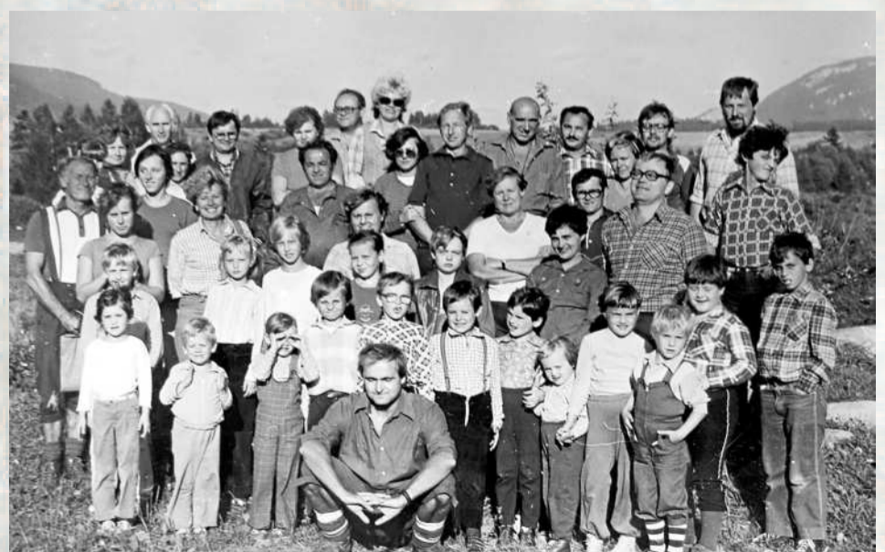
RODINNÉ FOTO účastníků zájezdu na Roháče v září roku 1985.

PŘÍŠTĚ, V PÁTEK 7. ČERVNA, ZAVÍTÁME DO KARVINÉ.