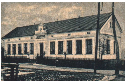
První česká škola v obci Šumbark okolo roku 1920. (dnes restaurace Tríska)