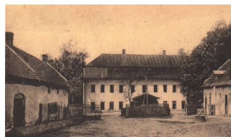
Zámek v Šumbarku s hospodářskými budovami v roce 1913.