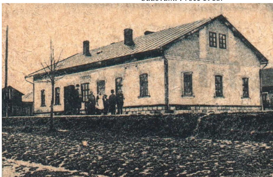
Restaurace Slonka v Šumbarku v roce 1919. (dnes pneuservis na ul. Požárnická)