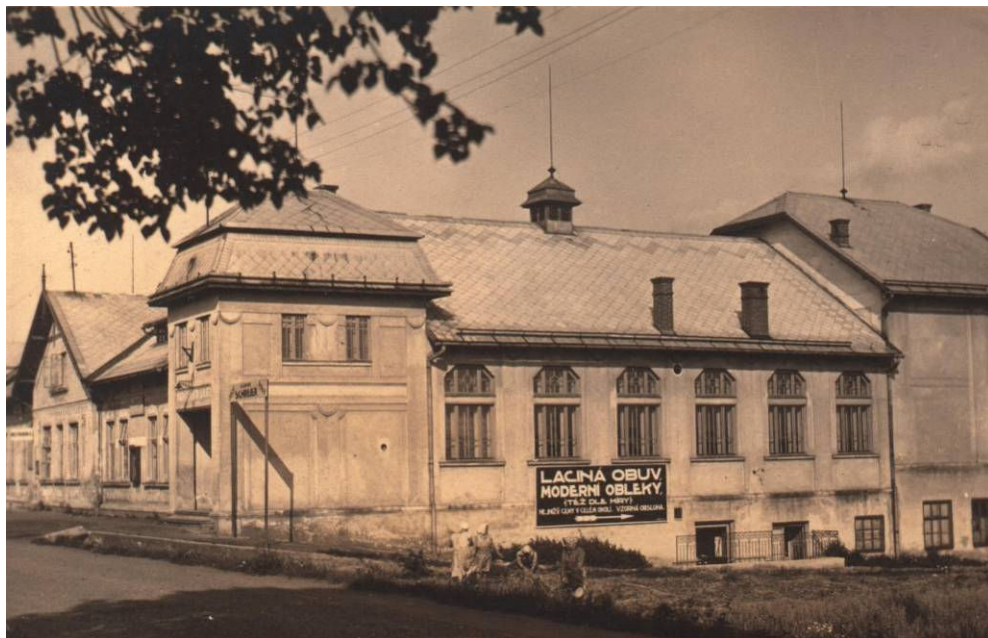
Jedna z dominantních budov Dolní Suché. Národní dům na dobové fotografii z roku 1930 se stal centrem sokolských sletů a dalších sportovních a kulturních aktivit. V důsledku poddolování byl spolu s celým okolím v 60. letech zbourán.