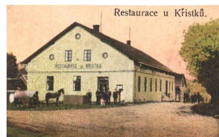
Restaurace U Křístků v Dolní Suché na dobové fotografii z roku 1916