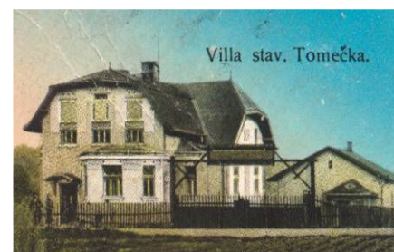
Vila stavitele pana Tomečka v Dolní Suché v roce 1916 (dům stále stojí na Orlovské ul.)