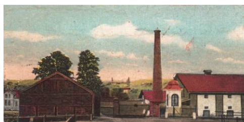
Dolní Suchá v roce 1915 – bývalý zámecký dvůr

16. století - V roce 1526 země Koruny české získávají na téměř 300 let Habsburkové. V tomtéž roce patřila celá Suchá Anně ze Suché. V 50. letech nastalo opět dělení a Dolní Suchou vlastnili Borkové z Roztropic. Petr Borek prodal v roce 1570 část území Janu staršímu Rostkovi ze Bzí. Pak následovali vlastníci na tomto území