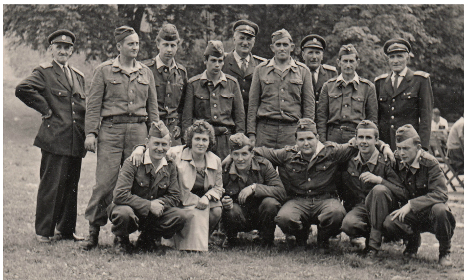
Dobráci ze Šumbarku na okrskové hasičské soutěži v roce 1963