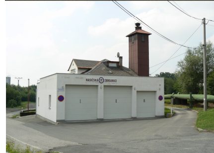
Podoba hasičské stanice v Šumbarku z roku 2010