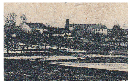
Budova dřevěné požární zbrojnice ještě na starém místě za obchodním domem Neufeld a Českou národní školou v roce 1926