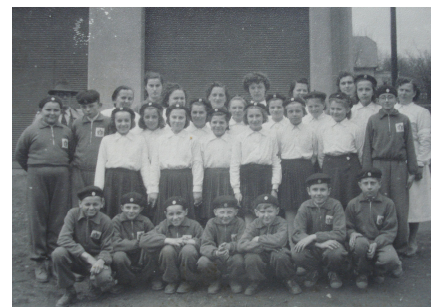
Sbor zdravotníků před budovou hasičárny na dobové fotografii z roku 1947