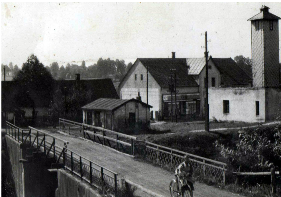
Požární zbrojnice dobrovolných hasičů v Šumbarku v roce 1945. V pozadí stojí obchodní dům Brada