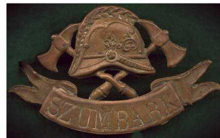
Odznak polského sboru dobrovolných hasičů v Šumbarku