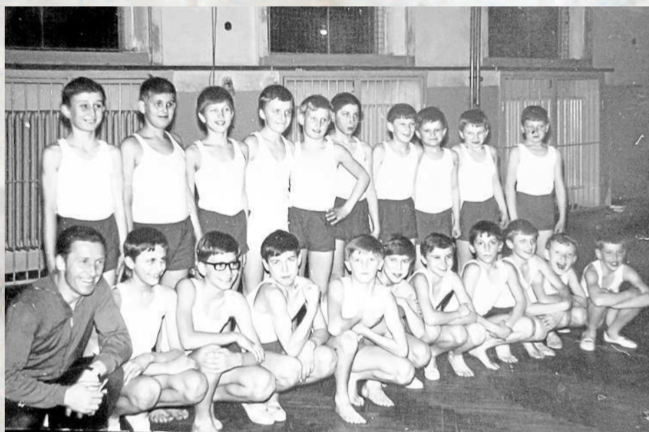
DĚTI Z TJ SLAVIA v roce 1968 se svým trenérem.