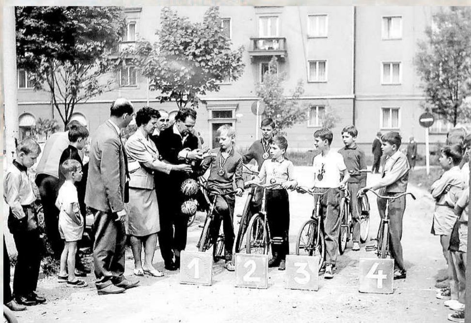
VELMI OBLÍBENÉ byly v mladém městě neformální závody dětí na kolech. Pokaždé dostaly i malou odměnu.