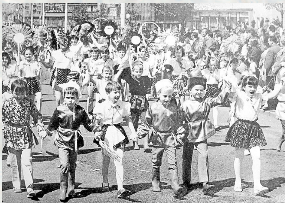
V PRVOMÁJOVÉM PRŮVODU nikdy nechyběly děti.