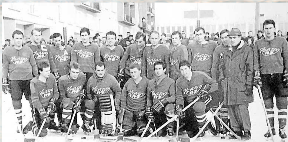
Mužstvo AZ Havířov v sezóně 1967/68