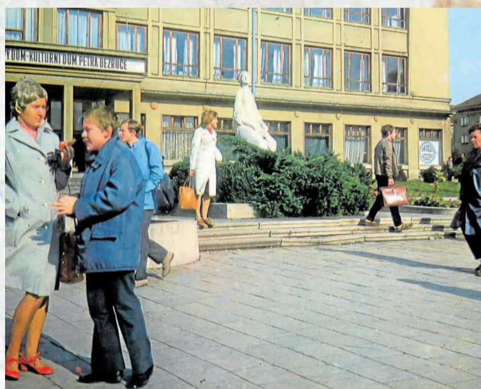
OTEVŘENÍ Kulturního domu Petra Bezruče v závěru roku 1963 výrazně obohatilo kulturní a společenský život Havířova.