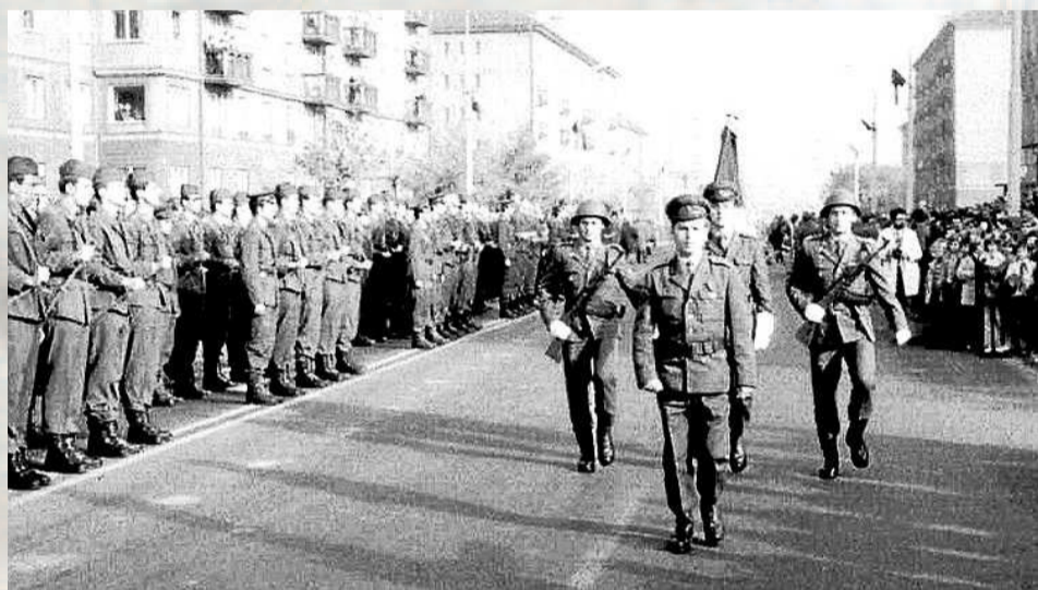
DEFILÉ VOJÁKŮ Československé lidové armády v Havířově u příležitosti oslav Velké říjnové socialistické revoluce. Sedmdesátá léta.