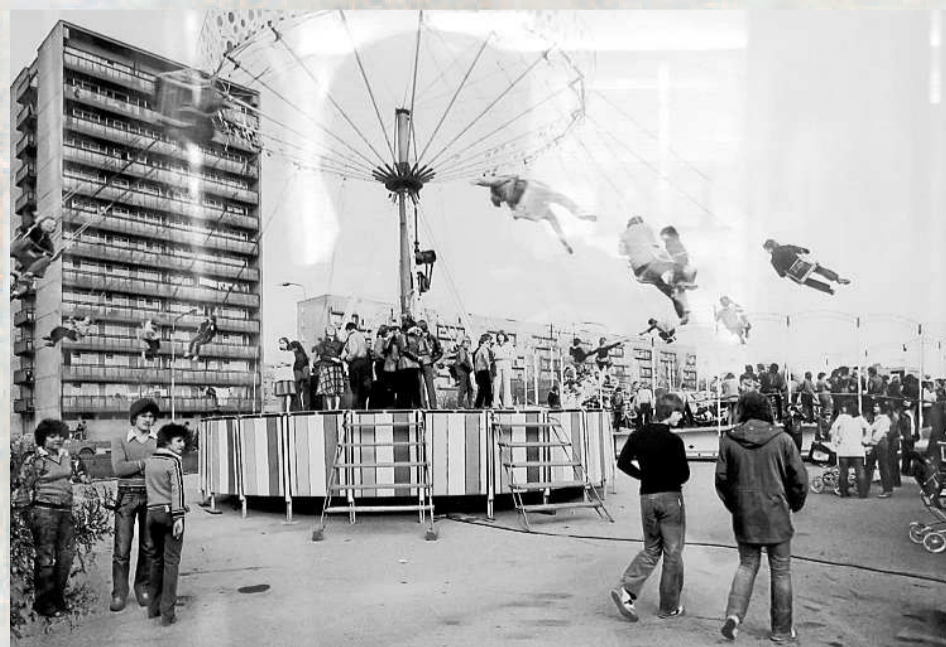
PROSTOR U ZIMNÍHO STADIONU , kde se nachází supermarket Kaufland byl dlouhá léta místem zábavy pro děti. Velké oblíbené se těšily hlavně kolotoče.

PŘÍŠTĚ, V PÁTEK 8. ÚNORA SE PODÍVÁME DO KARVINÉ.