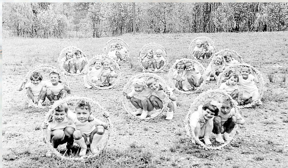
RADOVÁNKY. Děti ze Základní školy v Životicích se každoročně těšily na červnové radovánky. Na tuto akci se rodiče připravovali, maminky pekly koláče, zákusky, tatínkové dávali do pořádku hřiště.