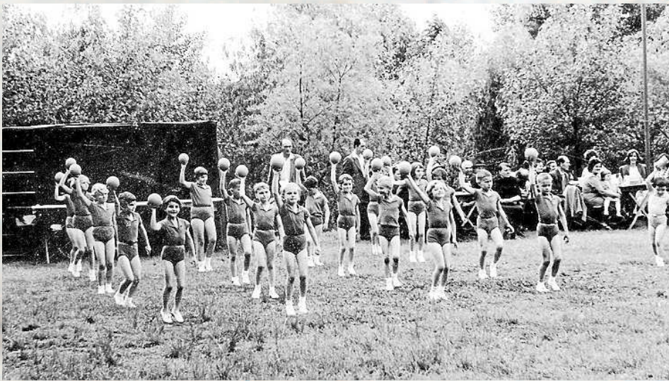
DĚTSKÉ ŠKOLNÍ RADOVÁNKY. Děti z životické školy při červnových radovánkách v roce 1962.

V dalším dílu retrospektivního seriálu popisujícího život na Karvinsku mezi lety 1918 až 1992 se podíváme do Životic, městské části Havířova, v 60. a 80. letech. Zavzpomínejte spolu s námi na události, které se odehrály v časech dávno i nedávno minulých, připomeňte si organizace, spolky a obyvatele, kteří v našem regionu žili, oživme paměť těch, kdo si dění vyobrazené na fotografiích pamatují. Pokud vlastníte dobové snímky ze svých obcí a měst, pošlete nám je i s popisem na e-mail tomas.januszek@denik.cz . V budoucnu je můžeme do seriálu zařadit! Seriál vychází u příležitosti loňského 100. výročí založení Československa. Stranu připravil: Tomáš Januszek