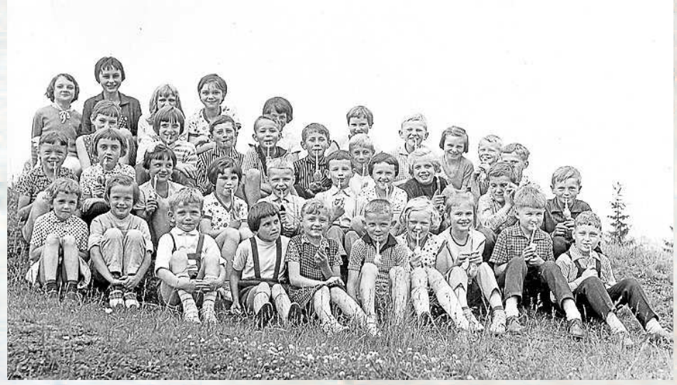
ŠKOLÁCI ze Životic na výletě do sklárny v Karolínce, který škola pořádala pro děti a rodiče.