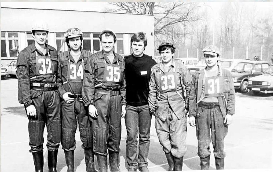
ČETA ZÁCHRANÁŘŮ DOLU DUKLA na 9. ročníku soutěže ZENIT v dubnu 1986 v Ostravě-Radvanicích. Dukláci vybojovali stříbrnou medaili.