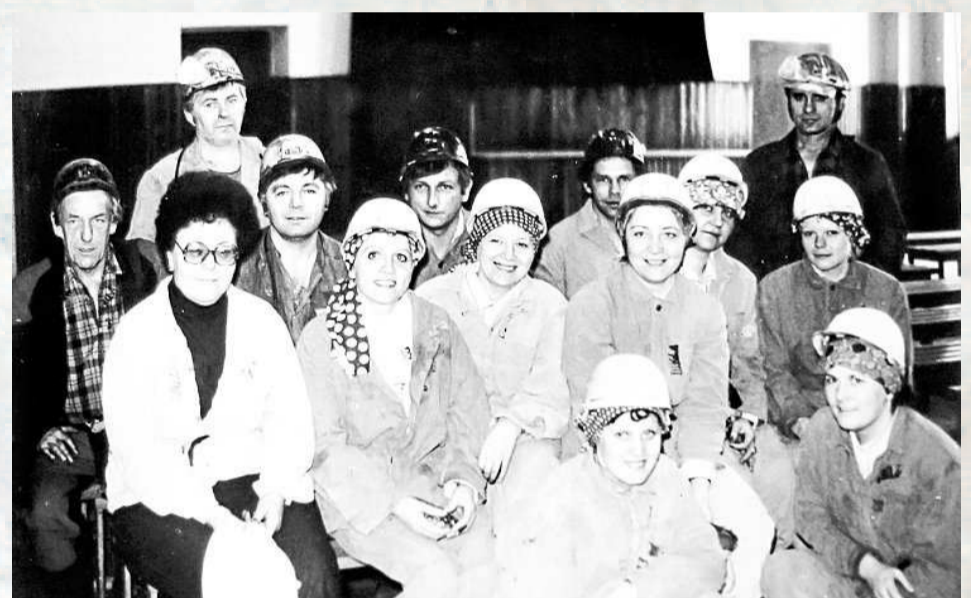
FÁRÁNÍ MANŽELEK záchranářů a střelmistrů.