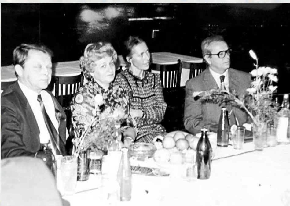
ZÁSTUPCI ZÁCHRANÁŘŮ blahopřáli učitelkám patronátní třídy k MDŽ.