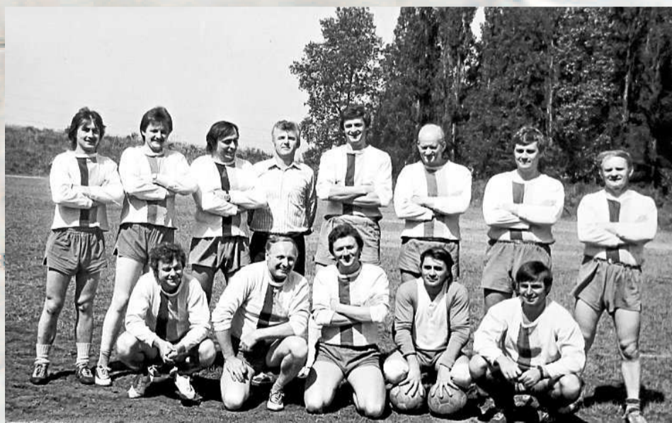
FOTBALOVÉ MUŽSTVO ZÁCHRANÁŘŮ DOLU DUKLA . Zápas se svislou dopravou skončil debaklem. Záchranáři prohráli 0:5.