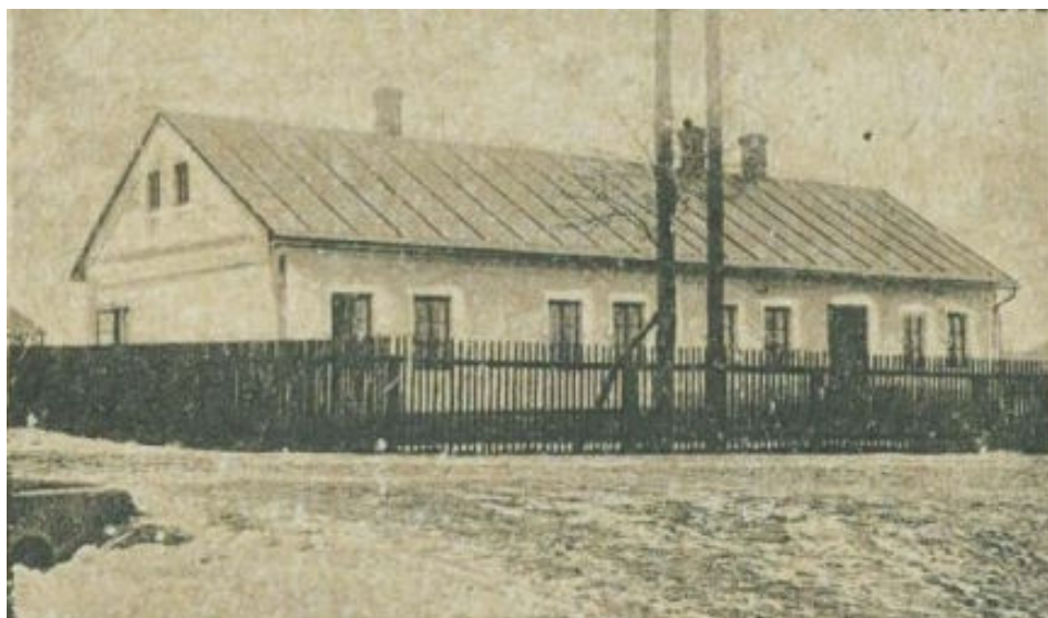
Četnická stanice v Šumbarku na dobové pohlednici z roku 1920