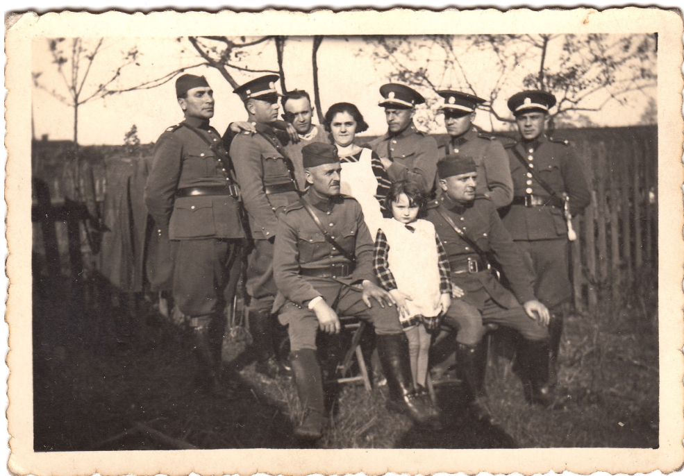
Příslušníci četnického sboru ve stanici Šumbark na dobové pohlednici z roku 1925