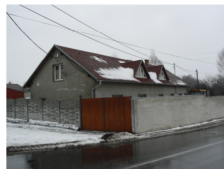
Budova četnické stanice v současnosti

nikdy objasněno a také nebylo jediným a posledním incidentem na Těšínsku. (Kamil Křenek)