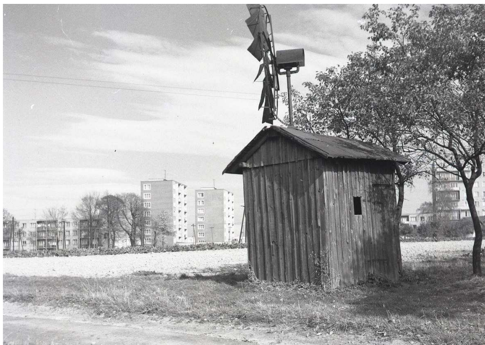
Fotografie zaniklého větrného mlýnku v Havířově u zimního stadionu. Stával přibližně v místech dnešního obchodního domu Kaufland.