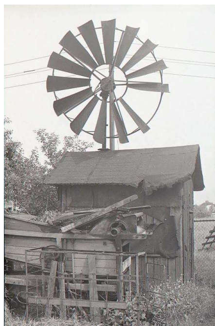
Větrný mlýnek s turbínou na území dnešního Havířova v ulici U skleníků 3