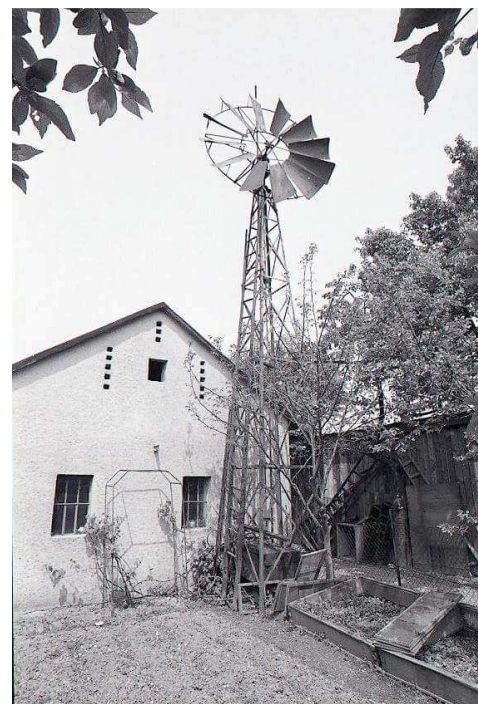
Větrný mlýnek s turbínou v Dolních Datyních. Ulice Formanská 10