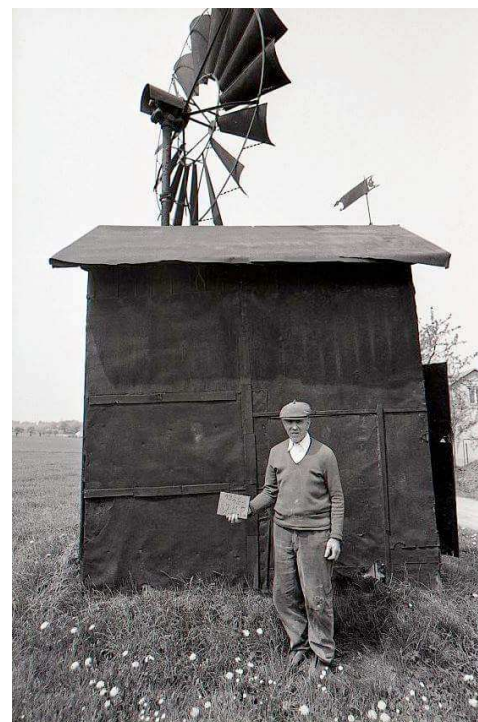
Dolní Datyně a větrný mlýnek s majitelem v ulici Na důlníku 18

Dnes máme 80 větrných mlýnků, různého typu poškození až po perfektní stav a když uvážíte, že se postavilo asi 1000 mlýnků, je to žalostné číslo. Proto se je snažíme chránit, i když jsou v soukromém držení. Pokud jej majitel už nechce, pokusíme se najít nového majitele a lokalitu. Takto jsme zachránili asi 10 mlýnků.